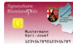
T-Telesec Netkey 4